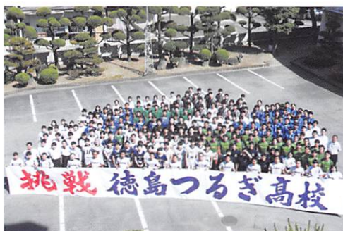
県高校総体壮行会